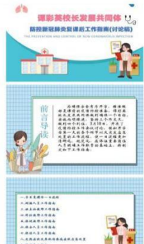
《精准预研 确保安全复学》网上交流活动