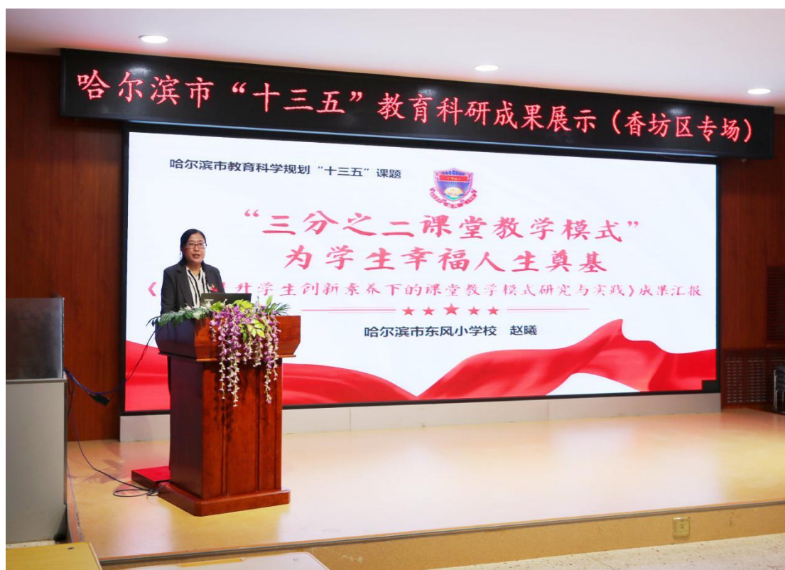
哈尔滨市“十三五”教育科研课题阶段性成果汇报