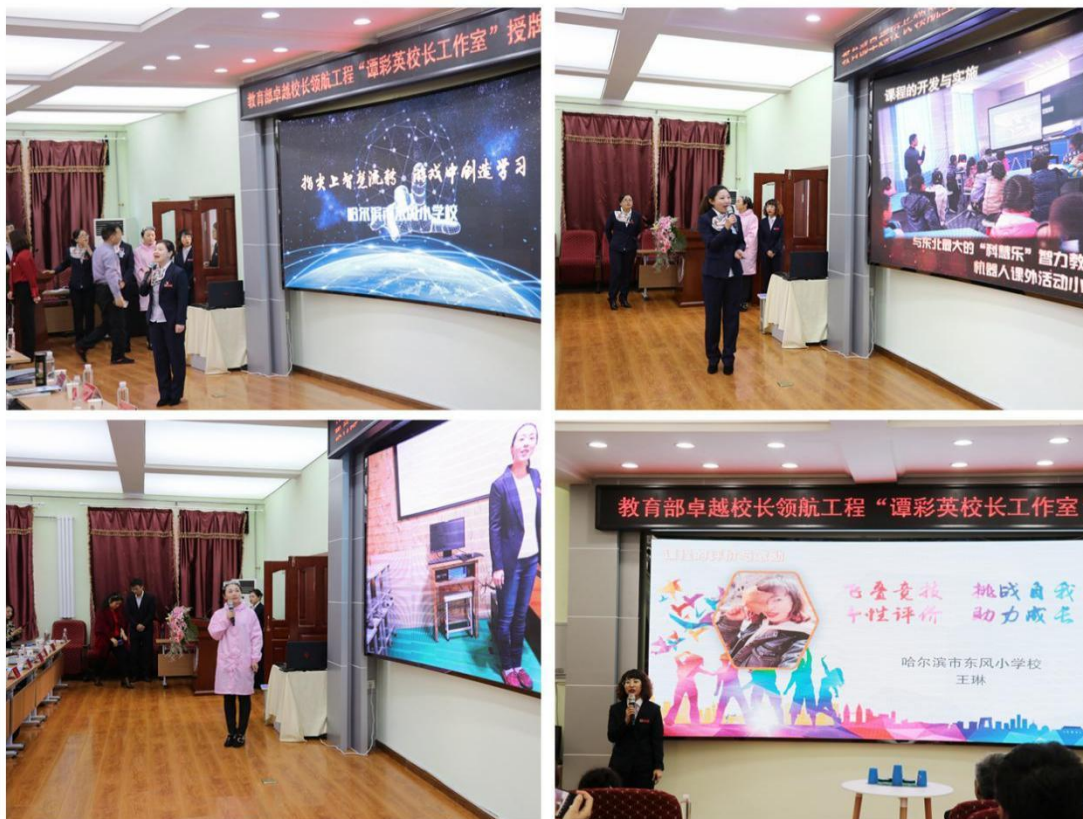
东风小学教师团队主题展示