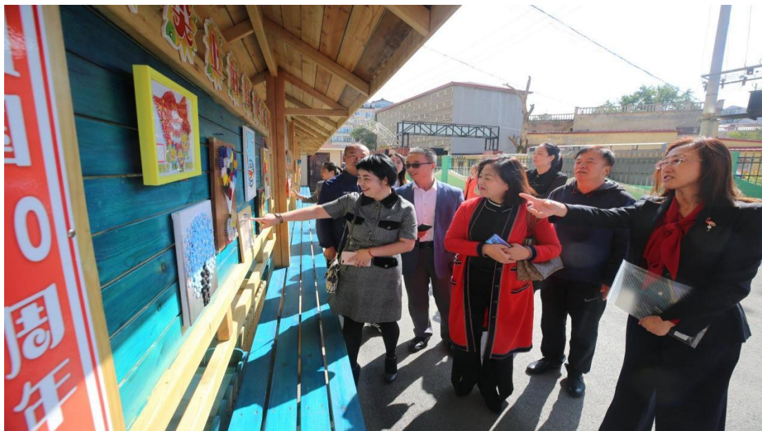
工作室成员走进东风小学感受学校建设成果、校园文化和课程文化

工作室定期开展校际交流活动，每学期至少安排两所学校进行主题交流展示。名师牵头，成立4个跨学校名师团队，定期线上开展教学研讨活动。2019年9月各成员校长一起走进东风小学感受以“创新实践”为办学特色的学校建设成果，“科技馆里的学校”为主题的校园文化，“指尖上的智慧——做中学”为主题的课程文化。