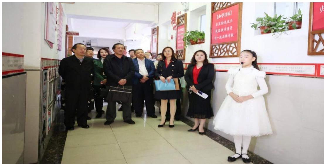
工作室成员走进香坊小学完善“构建臻美课程体系”特色课程建设 2019年7月—9月多次走进新建学校阿城金源小学，帮助确立以“源”文化

2019年5月走进香坊小学完善以“构建臻美课程体系 全面推动学校教育品质提升”特色课程建设。