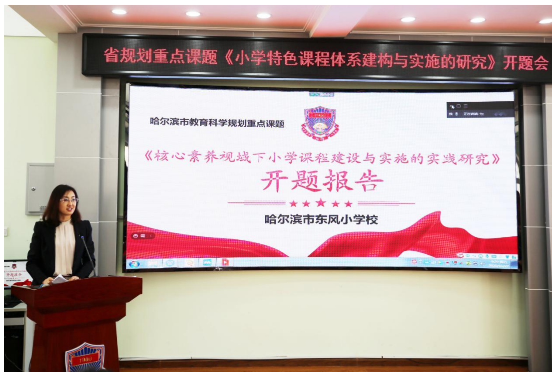
黑龙江省重点课题《核心素养视野下小学课程建设与实施的实践研究》开题会

成员校围绕主题分头开展研修工作，定期上传研究成果，大家群策群力提建议、说想法，把脉问诊，促进各校更好发展，很好发挥团队作用。