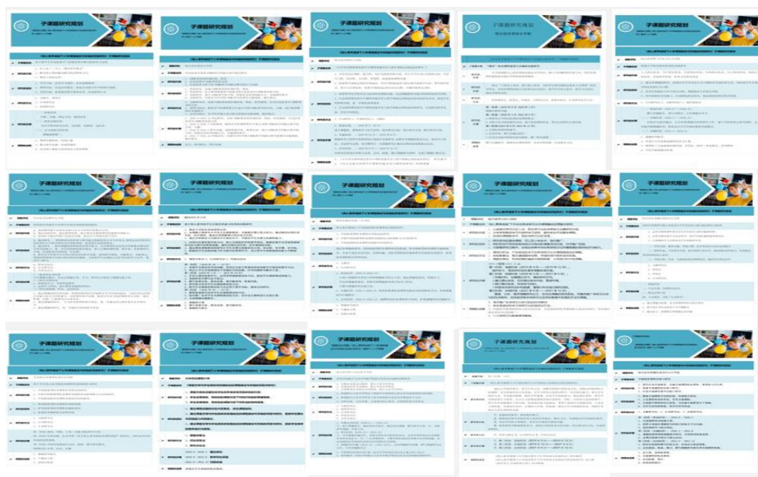
各成员校重点课题中的科研子课题

工作室通过对成员学校问卷调查，借助学校发展现状 SWOT 分析，确定用课题研究的方式推动工作室各校的发展，确立科研课题《核心素养视野下小学课程建设与实施的实践研究》，并被列为哈尔滨市规划重点课题，2020 年召开开题会和阶段性成果汇报会。