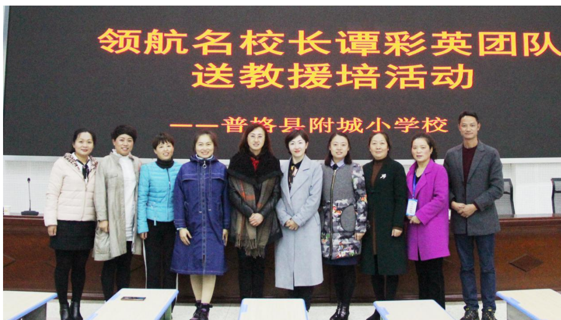
搭建共学共融共生共行平台助力普格基础教育发展