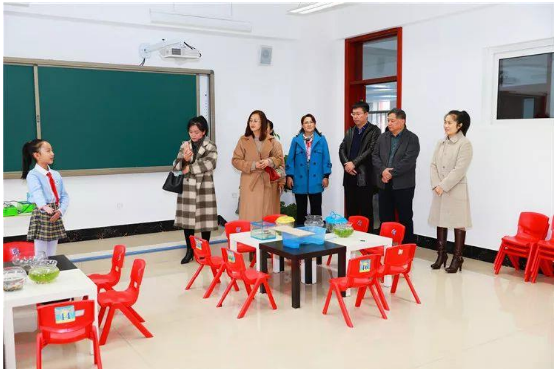
工作室成员走进阿城金源小学进行“寻源”课程建设活动

2019年7月走进哈尔滨市和平小学校，梳理学校“劳动教育”为主题的课程文化建设体系。